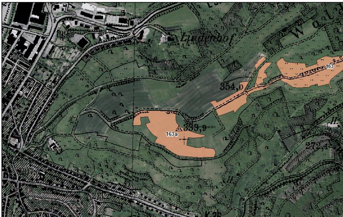
Abbildung 1 Gebiet Nr. 163a

Es soll dennoch als Eignungsgebiet PV in den sachlichen Teil-Flächennutzungsplan Regenerative Energien aufgenommen werden.